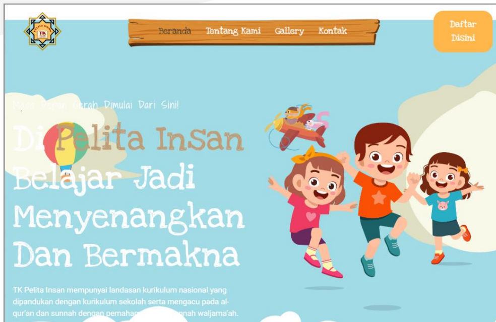
Gambar 1. Halaman Beranda Website