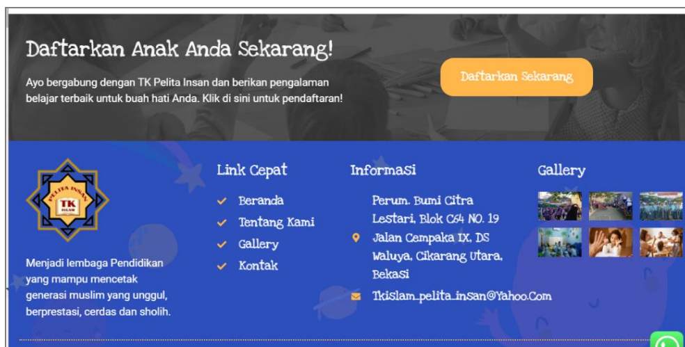
Gambar 3. Halaman Link Cepat