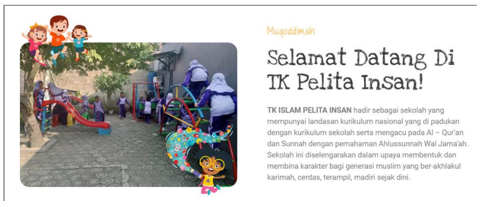
Gambar 2. Halaman Selamat Datang